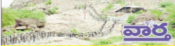
ఖమ్మం, కార్పొరేషన్, రఘునాథపాలెం, కల్లరల్, ఖమ్మం రూరల్