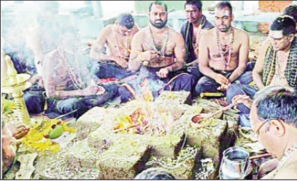
ఇల్లందు టౌన్, ప్రభాతవార్త: