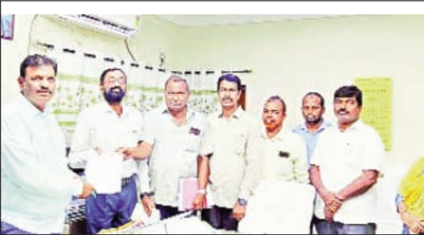
కొత్తగూడెం, నవంబర్ 16 - ప్రభాతవార్త: