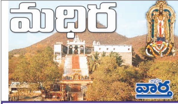
మధిర, బోనకల్, చింతకాని, ఎర్రపాలెం, ముదిగొండ

దృష్టి సారించి పరిష్కార దిశగా ప్రయత్నాలు కొనసాగిస్తారని మండల ప్రజలు ఆశాభావం వ్యక్తం చేస్తున్నారు. ఆర్వోబి పై నేటికీ విద్యుత్ సౌకర్యం లేదా...! నిత్యం వందల వాహనాలు ఈ ఆరీ వో బి పై నుండి రాకపోకలు సాగిస్తున్నాయి. అయినప్పటికీ ఆరీ ఓ బి కి ఇప్పటివరకు విద్యుత్ సౌకర్యం లేకపోవడం శోచనీయం. భారీ వాహనాలు ప్రయాణిస్తున్న ఈ బ్రిడ్జిపై విద్యుత్ సౌకర్యం లేకపోవడంతో రాత్రి వేళల్లో ప్రమాదాలు జరిగిన సంఘటనలు కూడా ఉన్నాయి. ఈ ప్రమాదాలు నివారించే క్రమంలో ఆరీ ఓ బి కి విద్యుద్దీకరణ చేయాల్సిన అవసరం ఉందని స్థానికులు కోరుతున్నారు.