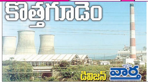
చుంచుపల్లి, జూలూరుపాడు, సుజాతనగర్