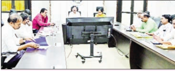
కొత్తగూడెం, నవంబర్ 16 - ప్రభాతవార్త:

సింగరేణి సంస్థ సి ఎండి ఎస్.బలరామ్ ఆదేశాల మేరకు రామగుండం రీజియన్ లో విధులకు గైర్వాజరు అవుతున్న ఉద్యోగులకు నిర్వహించే కౌన్సిలింగ్ మరియు రోజువారీ విధులకు హాజరయ్యేందుకు తీసుకునే క్రమశిక్షణాచర్యలపై రామగుండం1, రామగుండం2, రామగుండం3, భూపాలపల్లి ఏరియాల పర్సనల్, ఐఈడి డిపార్ట్మెంట్ అధికారులతో శనివారం నాడు సింగరేణి ప్రధాన కార్యాలయ వీడియో కాన్ఫరెన్స్ హాల్ నుండి వీడియో కాన్ఫరెన్స్ ద్వారా జిఎం(పర్సనల్) ఐఆర్ పిఎం కవితా నాయుడు సమీక్షను నిర్వహించారు. ఈ సందర్భంగా రామగుండం1, రామగుండం2, రామగుండం3, భూపాలపల్లి ఏరియాల వారిగా 2024 సంవత్సరం లో విధులకు గైర్వాజరు అవుతున్న ఉద్యోగులకు నిర్వహించే కౌన్సిలింగ్ మరియు తీసుకునే క్రమశిక్షణాచర్యలపై సమీక్షించి విధులకు గైర్వాజరు అయ్యే ఉద్యోగులకు వారి కుటుంబ సభ్యులతో కలిసి కౌన్సిలింగ్ నిర్వహించాలని తద్వారా ఉద్యోగి రోజువారీగా విధులకు హాజరయ్యేలా చూడాలని తెలిపారు. 2024 సంవత్సరం లో ఇప్పటి వరకు 75 ముస్యర్లు కంటే తక్కువగా ఉండి ఉన్న విధులకు గైర్వాజరు అవుతున్న మొత్తం 771 మంది ఉద్యోగులను గుర్తించామని అందులో రామగుండం1 ఏరియా నుండి: 275, రామగుండం2 ఏరియా నుండి: 108, రామగుండం3 ఏరియా నుండి: 126, భూపాలపల్లి ఏరియా నుండి: 262 మంది ఉద్యోగులు ఉన్నారని తెలిపారు. ఈ కార్యక్రమంలో జిఎం(ఐఆర్ పిఎం) కవితా నాయుడు, ఏజిఎం(ఐఈడి) బొజ్జ రవి, ఏజిఎం(ఐఈ) సిహెచ్.వెంకయ్య, డిజిఎం(పర్సనల్) ఐఆర్ వింగ్ కె.అజయ్ కుమార్, రామగుండం1, రామగుండం2, రామగుండం3, భూపాలపల్లి ఏరియాల పర్సనల్ మరియు ఐఈడి డిపార్ట్మెంట్ అధికారులు పాల్గొన్నారు.